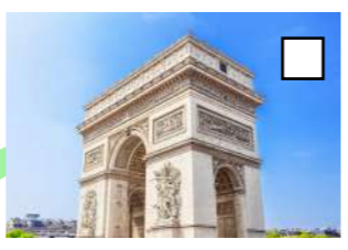
Arc de Triomphe Terrasse des vents, parc des chantiers

Marchons encore quelques mètres pour nous mettre en appétit vers Le Jardin Extraordinaire aménagé au sein d'une ancienne carrière de granit désaffectée :