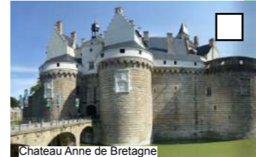
Château Anne de Bretagne

Sur le trajet vous allez pouvoir découvrir (entre autre) sur votre gauche le Lieu Unique (ancienne usine de la biscuiterie LU), à droite le château Anne de Bretagne , et sur votre gauche, le terrain de Foot « Feydball » ainsi que l'île Feydeau