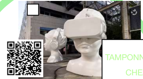
In a silent way, Nathalie TALEC, 2021, rue de la Tour d'Auvergne