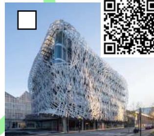
Air, Rolf JULIUS, 2010, Bâtiment MANNY, 19 bis rue de la noue Bras de fer