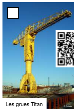
Les grues Titan

TAMPONNE MOI CHEZ BOUTIQUE-LIBRAIRIE DES MACHINES DE L'ÎLE