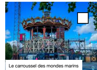
Le carrousel des mondes marins