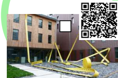
Mètre à Ruban, Lilian BOURGEAT, 2012 34 rue de la noue bras de fer