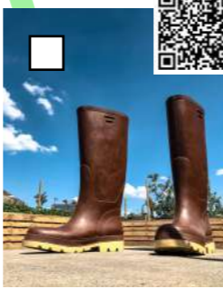
Invendus-bottes, Lilian BOUGEAT, 2020 Potager de la cantine du voyage