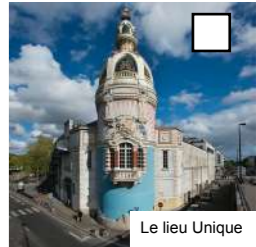
Le lieu Unique

Nous nous arrêterons à l'arrêt Chantiers Navals pour découvrir le Mémorial de l'esclavage conçu par l'artiste polonais Krzysztof Wodiczko et l'architecte américano-argentin Julian Bonder inauguré en 2012.