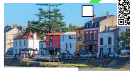
Vue du quartier TRENTEMOULT

Maintenant nous allons prendre le Navibus, vous apercevez de loin le village de pêcheur situé dans le quartier de Trentemoult de Rezé