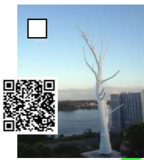
Lunar Tree, MRZYK & MORICEAU, 2012