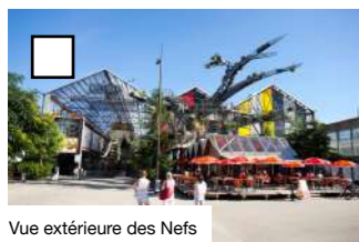
Vue extérieure des Nefs

Vous y trouverez les Machines de l'île et son fameux éléphant, la salle de concert Stereolux et son laboratoire Trampolino ainsi que des graffitis urbains.