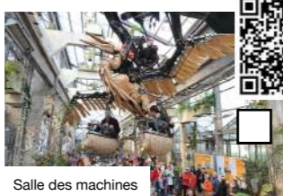
Salle des machines