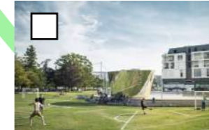
Feydball, BARRÉ-LAMBOT architectes, 2015