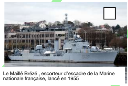
Le Maillé Brézé , escorteur d'escadre de la Marine nationale française, lancé en 1955