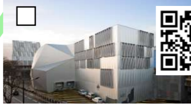
Salle de concert Stereolux conçue par Tétrac architectes en 2011 et derrière bâtiment Trampolino, laboratoire artistique, BARRÉ-LAMBOT architectes.

Maintenant nous allons prendre le Navibus, vous apercevez de loin le village de pêcheur situé dans le quartier de Trentemoult de Rezé