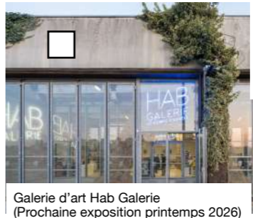
Galerie d'art Hab Galerie (Prochaine exposition printemps 2026)