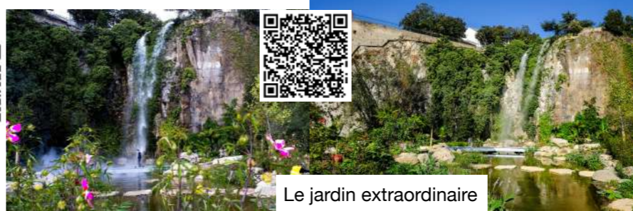
Le jardin extraordinaire

Marchons encore quelques mètres pour nous mettre en appétit vers Le Jardin Extraordinaire aménagé au sein d'une ancienne carrière de granit désaffectée :