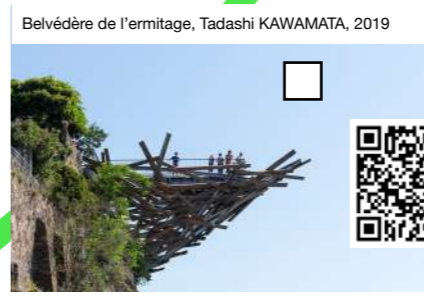
Belvédère de l'ermitage, Tadashi KAWAMATA, 2019