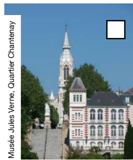
Musée Jules Verne, Quartier Chantenay

Nous allons maintenant marcher 15' jusqu'au tramway ligne 1 direction Beaujoire/Babinière à gare Gare Maritime et nous arrêter à l'arrêt Bouffay.