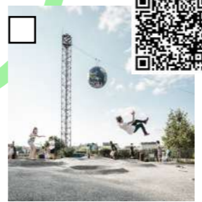
On va marcher sur la lune, Detroit Architectes & Bruno PEINADO, 2015