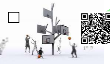
L'arbre à basket, Agence A/LTA, 2012 Esplanade des traceurs de coques, parc des chantiers

Au niveau du parc des chantiers et jusqu'au Hangar à Bananes vous pourrez découvrir d'autres oeuvres pérennes du Voyage à Nantes telles que :