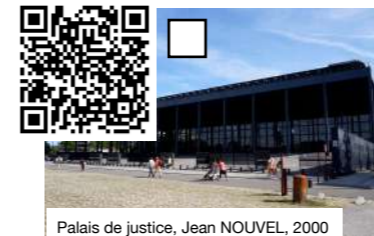
Palais de justice, Jean NOUVEL, 2000

Bienvenus dans le quartier de l'île de Nantes (une partie de cet îlot est appelé le quartier de la création (écoles d'arts,, de design, d'architecture... Y ont été regroupées ainsi que la salle de spectacle Stéréolux ) où vous allez pouvoir découvrir plusieurs oeuvres pérennes du Voyage à Nantes