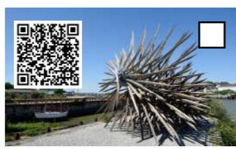
Résolution des forces en présence, Vincent MAUGER, 2014