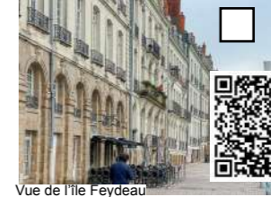
Vue de l'île Feydeau